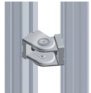
Gelenk 28/ 1,1" Pivot Joint 28/ 1.1"